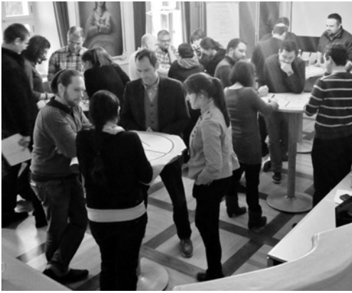
Ehrenamtliche und hauptamtliche MitarbeiterInnen von GFA bei der Jahresanfangsklausur.