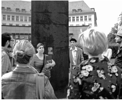
Gemeinsamer Rundgang beim Ausflug des AK Fürth zu den KollegInnen in Bamberg.