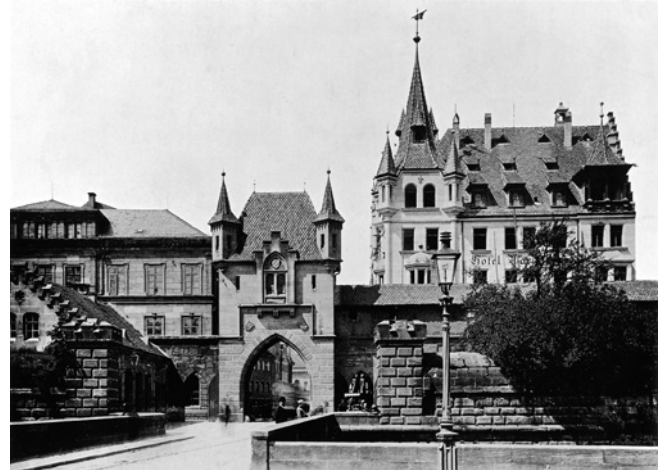
Neue Tore sollten im 19. Jahrhundert die Stadt in Richtung der schnell wachsenden Vorstädte öffnen. Hier das Marientor als Verbindung zur neuen Marienvorstadt, Fotografie 1890.

Trotz ihrer herausragenden stadt- und architekturgeschichtlichen Stellung, die in ganz Deutschland ihresgleichen sucht, fehlt bis heute ein Gesamtkonzept für den Umgang mit einer der längsten und mächtigsten Befestigungsanlagen Mitteleuropas. Selbst in Reiseführern wird die Stadtmauer,