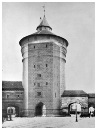
Der runde Spittlertorturm ummantelt den ursprünglich eckigen Torturm, Fotomontage von Wilhelm Kriegbaum 1965.

Diese Überlegungen konkretisierten sich nach 1866 mit dem Wegfall der Festungseigenschaften. Ein kompletter Abriss wurde jedoch buchstäblich in letzter Minute verhindert, nicht zuletzt dank einer Intervention des bayerischen Herrschers Ludwig II. Dennoch trugen die Befestigungsanlagen einige bis heute sichtbare, tiefe Narben davon, wie etwa den Abbruch der Mauern und des Torzingers am Laufer Tor oder die Einlegung fast aller im 19. Jahrhundert neu geschaffenen Tore. An mehreren Stellen wurden die Stadtmauer und der Stadtgraben überbaut,