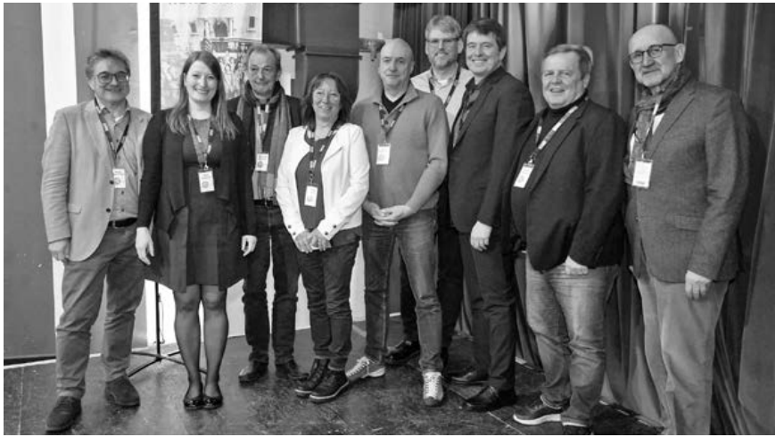
Im Rahmen des Ehrungsabends wurden auch unsere Vereinsgründerinnen und -gründer (hier zusammen mit dem Vorstand) nicht nur für ihre Idee und ihr Engagement rund um die Gründung von Geschichte Für Alle, sondern auch für 40 Jahre Mitgliedschaft geehrt.

In entspannter Atmosphäre bot der Abend viel Raum für persönliche Gespräche, gemeinsame Rückblicke und Begegnungen über Ressort- und Generationengrenzen hinweg. Der Ehrungsabend wird künftig jährlich im Herbst stattfinden. Schon jetzt freuen wir uns auf den Austausch mit allen, die im Jahr 2026 ein Vereinsjubiläum feiern.