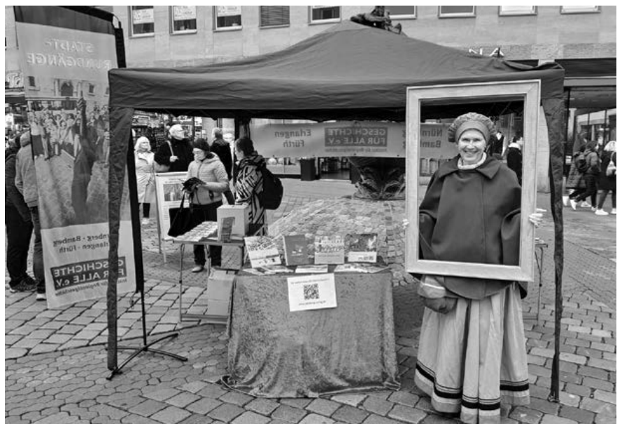
Bei Infoständen und Aktionstagen im Jubiläumsjahr (hier in der Nürnberger Altstadt) präsentierten wir die Arbeit von Geschichte Für Alle.