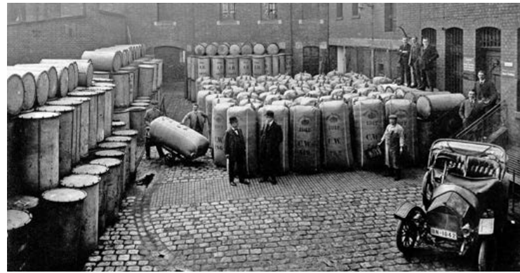
Neben dem Textil-, Schuh- und Spielwarenhandel waren jüdische Unternehmen vor allem in den Hopfenhandel involviert. In der Fürther Straße 17 befand sich der Wohn- und Firmensitz der Familie Kirschbaum. Im Hinterhof lagerten die luftdichten Blechtonnen mit geschwefeltem Hopfen. Fotografie 1912.

Trotz der großen Fortschritte sah sich die jüdische Bevölkerung weiterhin mit strukturellen Hürden konfrontiert, die ihre vollumfassende Integration verhinderten. Einige Berufsfelder etwa blieben weiterhin weitgehend verschlossen.