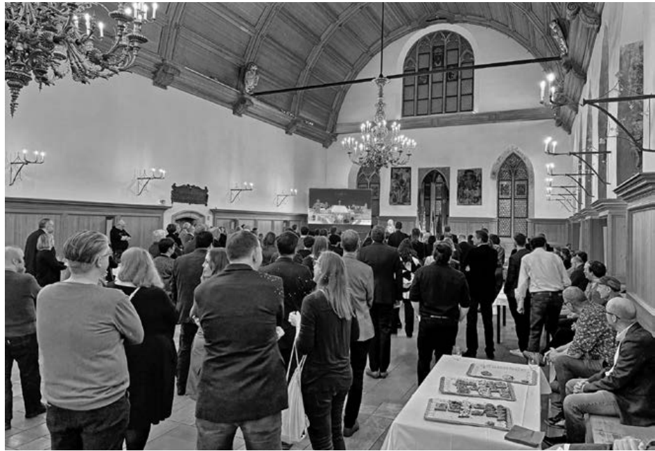
Gut gefüllt war der Historische Rathaussaal beim Empfang der Stadt Nürnberg anlässlich des 40-jährigen Vereinsjubiläums.

Das umfangreiche Jubiläumsprogramm war nur durch das Engagement vieler Beteiligter möglich. Ein herzlicher Dank gilt allen Mitarbeiter:innen,