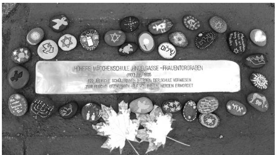
Nürnberg's erste Stolperschwelle befindet sich am Standort der ehemaligen Höheren Mädchenschule in der Findelgasse 9.

In Zusammenarbeit mit der Bayerischen Schlösserverwaltung hat Geschichte Für Alle ein neues Grundschulprogramm rund um das Thema »Wappen auf der Kaiserburg« entwickelt. Das Programm ist seit Oktober für Grundschulklassen buchbar. Unter dem Titel »Du führst doch was im Schilde!« gehen kleine Wappenforscher:innen im Palas der Nürnberger Kaiserburg auf Entdeckungstour. Gemeinsam wird erkundet, welche Wappen sich dort finden lassen, seit wann es Wappen gibt und was sie über ihre Träger erzählen. Zwischen kaiserlichen Adlern und Nürnberger Stadtwappen entdecken die Kinder spannende Details – und gestalten im Anschluss ihr ganz persönliches Wappen als Andenken an den Besuch.